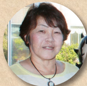
長崎ケアワーカー