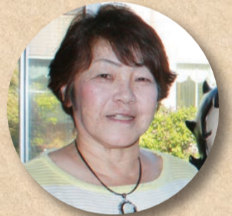
長崎ケアワーカー

8月のイベントは、8日に北海道科学大学～相羅～のよさこいソーラン節、24日には北海道VS名古屋を予定しています。 北海道と名古屋の良い所をアピール合戦し、皆様にどちらが良い所かを決めていただきます。 また、1日・2日のリラハピでは、売店の移動販売を行いますのでご期待ください。 まだまだ残暑が続きますので、引き続きこまめな水分補給を行いながらお過ごしください。 皆様からのご意見・ご要望をお待ちしております。