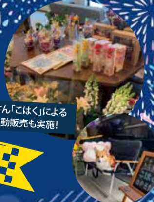
お花屋さん「こはく」による花の移動販売も実施!

射的・輪投げ・カラオケ・千本引き・屋台販売・職員による余興 早食い競争・ロシアンたこ焼き・お神輿・盆踊り 近づくお盆を一足お先に